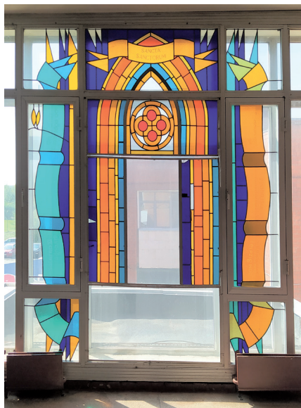
ул. Бр. Кашириных, 129